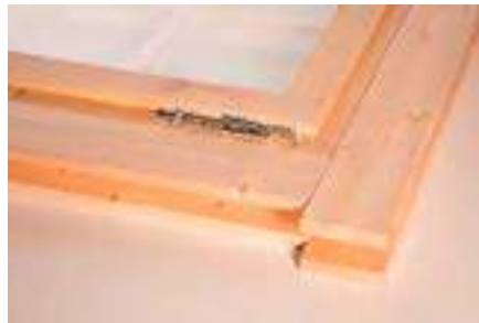
5. Ansicht fertig montierter Rahmen oben rechts, Blende innen u. außen