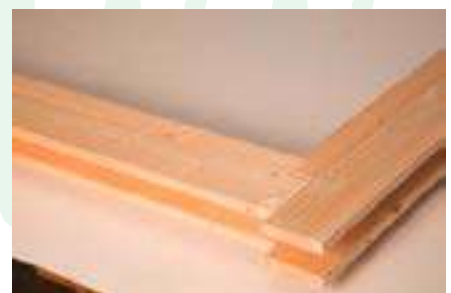
9. Ansicht fertig montierter Rahmen oben rechts