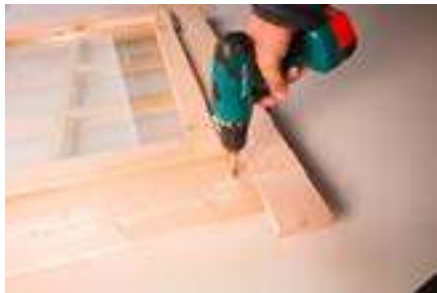
4. Fertig montierte Blenden, Fenster innen