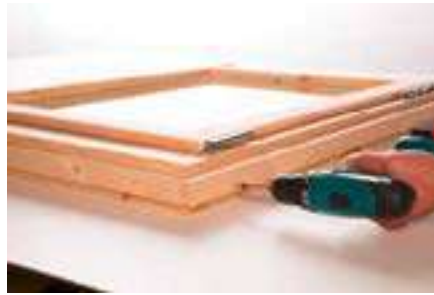
2. Anschrauben der Leisten