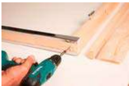
4. Anschrauben der unteren Türschwelle