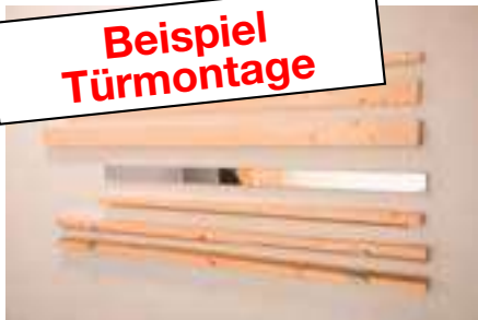
1. Türrahmen mit Leisten 3 x 28-70 mm und 6 Blenden