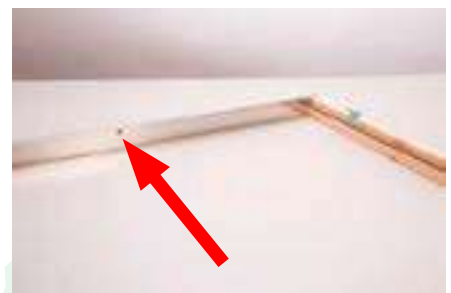
6. Das vorgebohrte Loch für den Feststeller muss nach außen zeigen