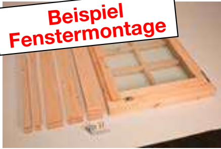
1. Einzelfenster mit Leisten, 8 Blenden und 1 Fenstergriff