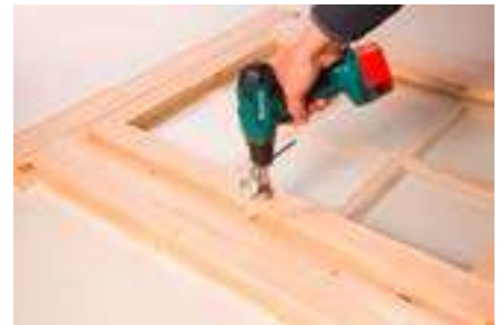
6. Anschrauben / Montage Fenstergriff