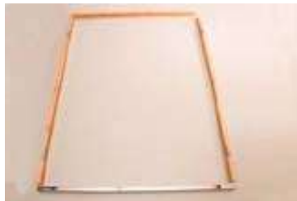
2. Positionieren der Rahmenteile