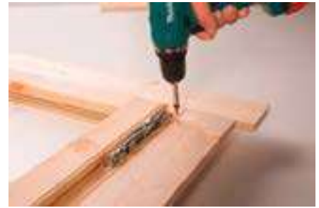
3. Anschrauben der Blenden