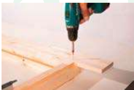
7. Anschrauben der Blende oben