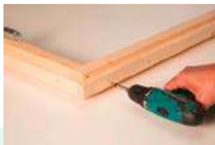
5. Leiste anschrauben