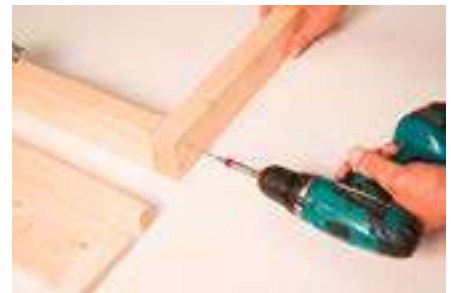
3. Türrahmen verschrauben