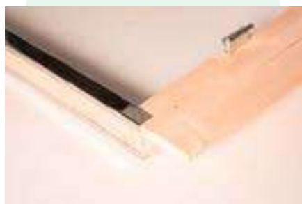
8. Seitenblende unterkante Türschwelle bündig