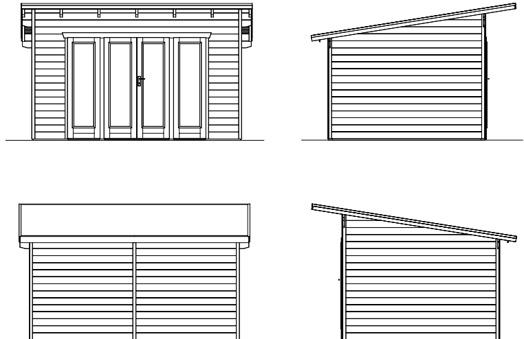
Grundriss, Schnitt und Ansichten M 1:100