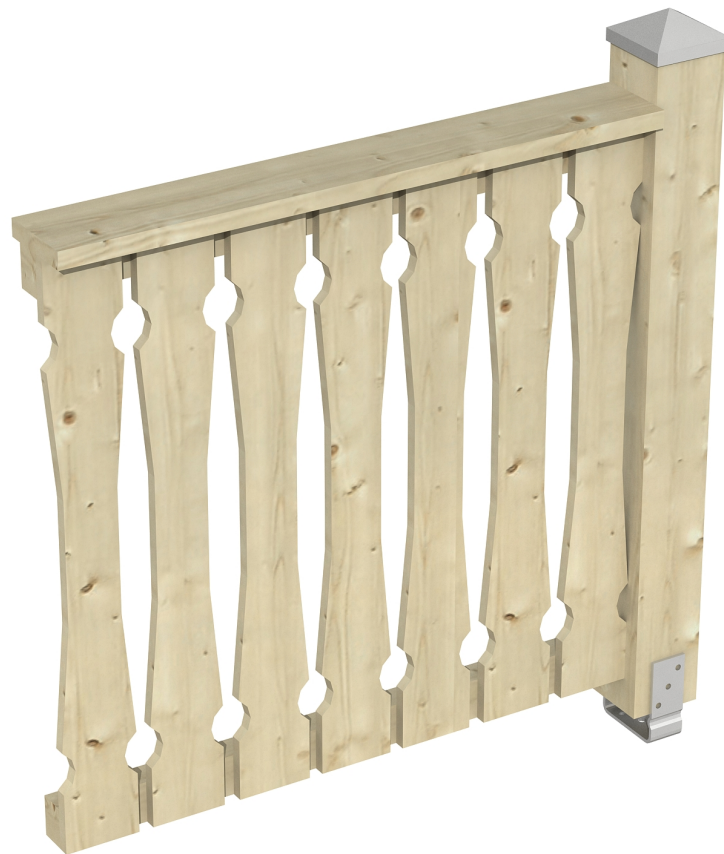
Produktbild Brüstung 108 cm