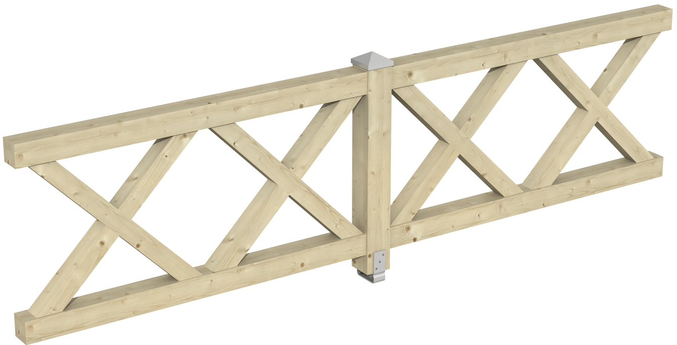
Produktbild AK-Brüstung 335cm