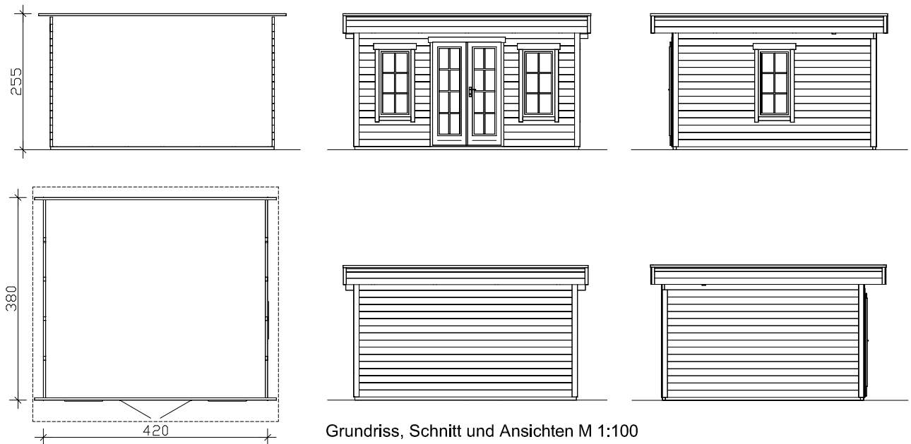
Grundriss, Schnitt und Ansichten M 1:100