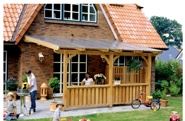
Kundenfoto: Terrassenüberdachung mit Brüstungen und Seitenwand