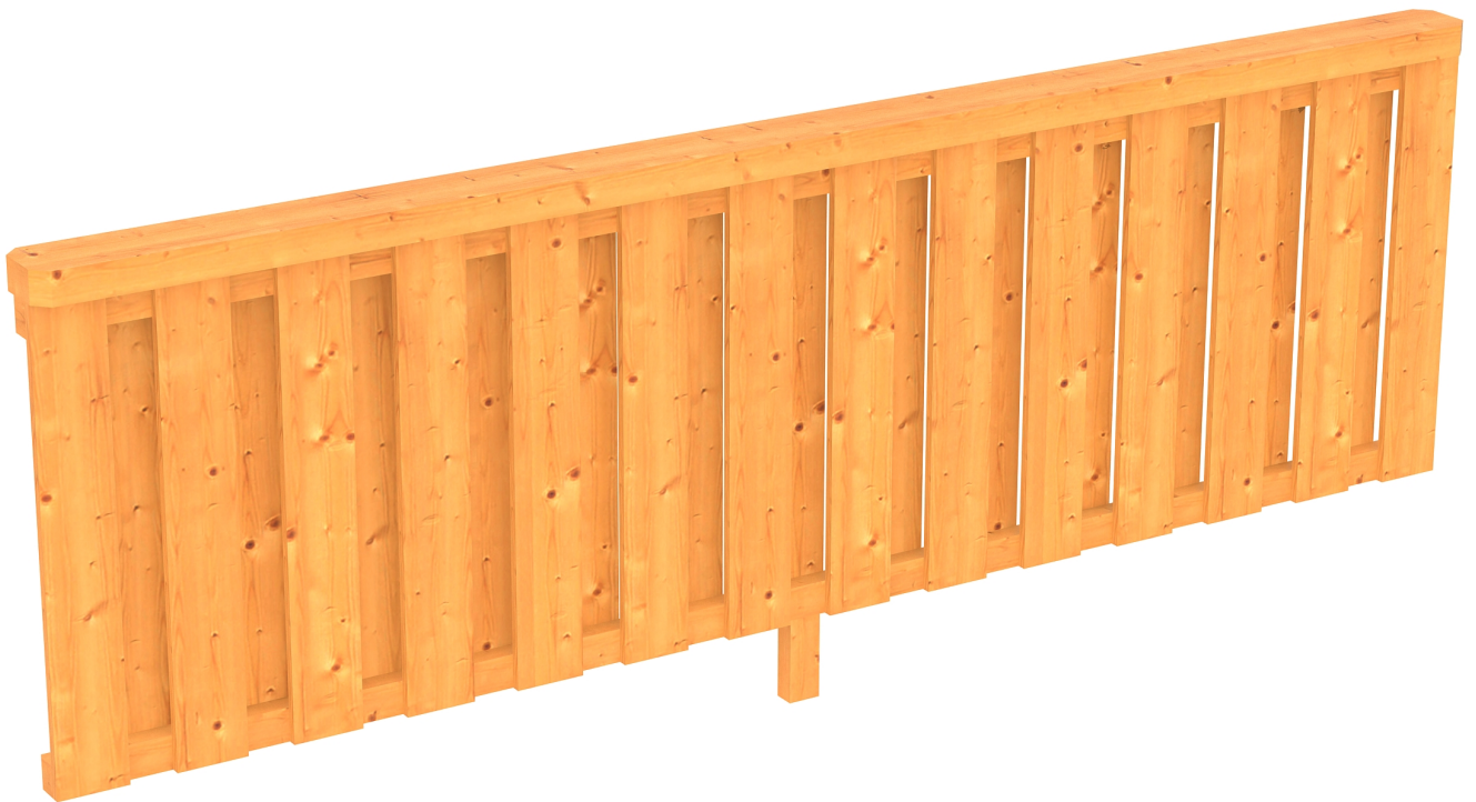
Produktbild Brüstung Deckelschlung 270cm