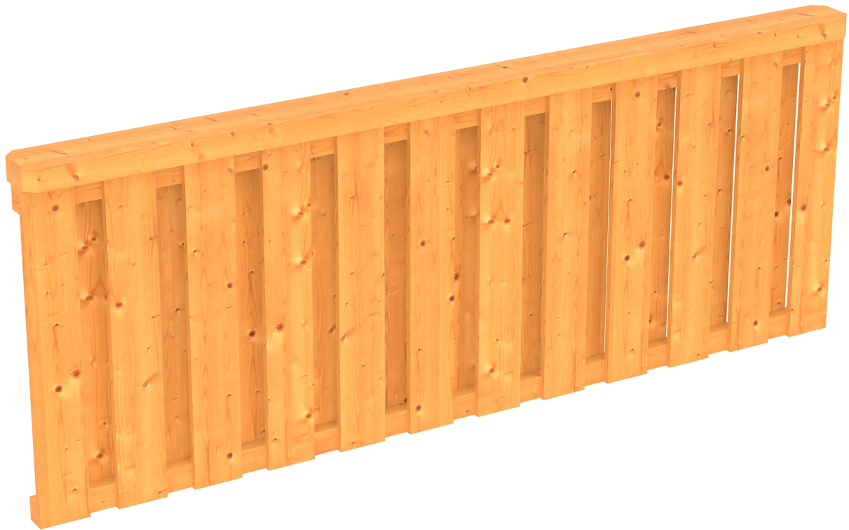
Produktbild Brüstung Deckelschlung 220cm