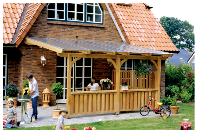
Kundenfoto: Terrassenüberdachung mit Brüstungen und Seitenwand