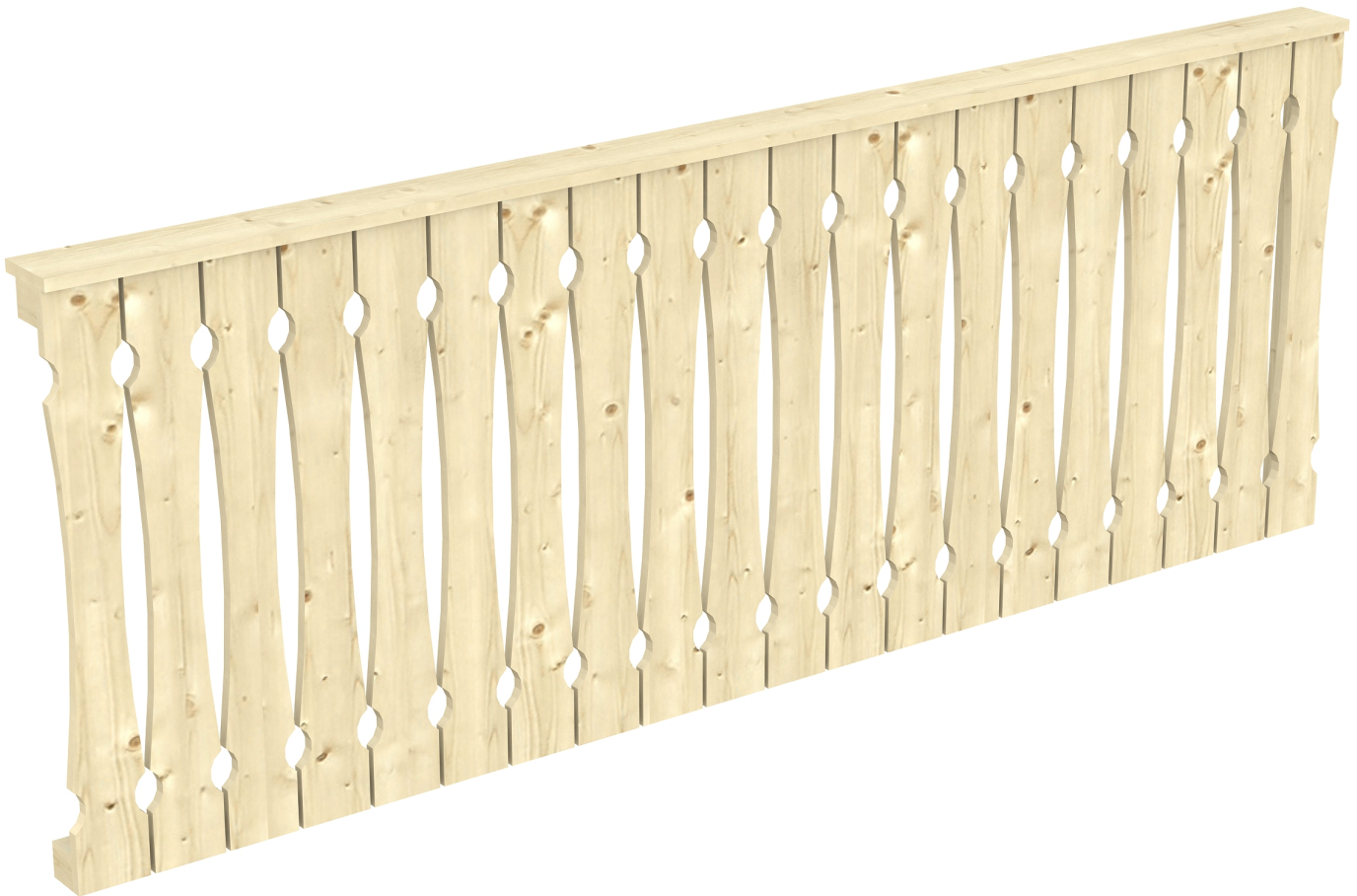
Produktbild AK-Seitenwand 255cm