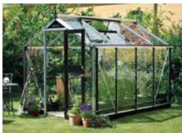
Gewächshaus mit Glas.