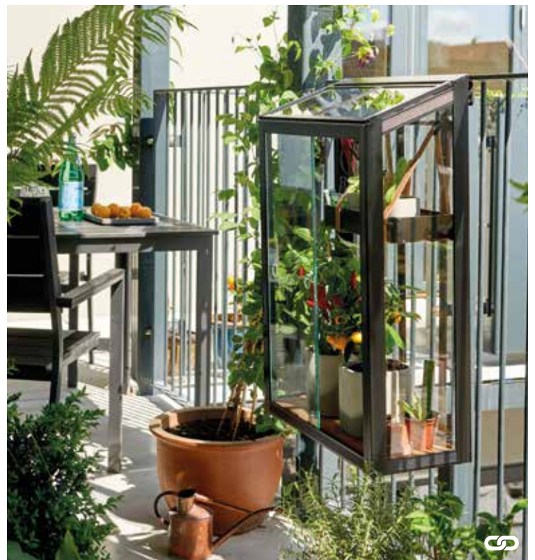
Juliana Balcony kann auf dem Balkon aufgestellt, oder an der Wand befestigt werden.