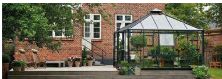
Pavillon à la Juliana Oase. Siehe Seite 16.