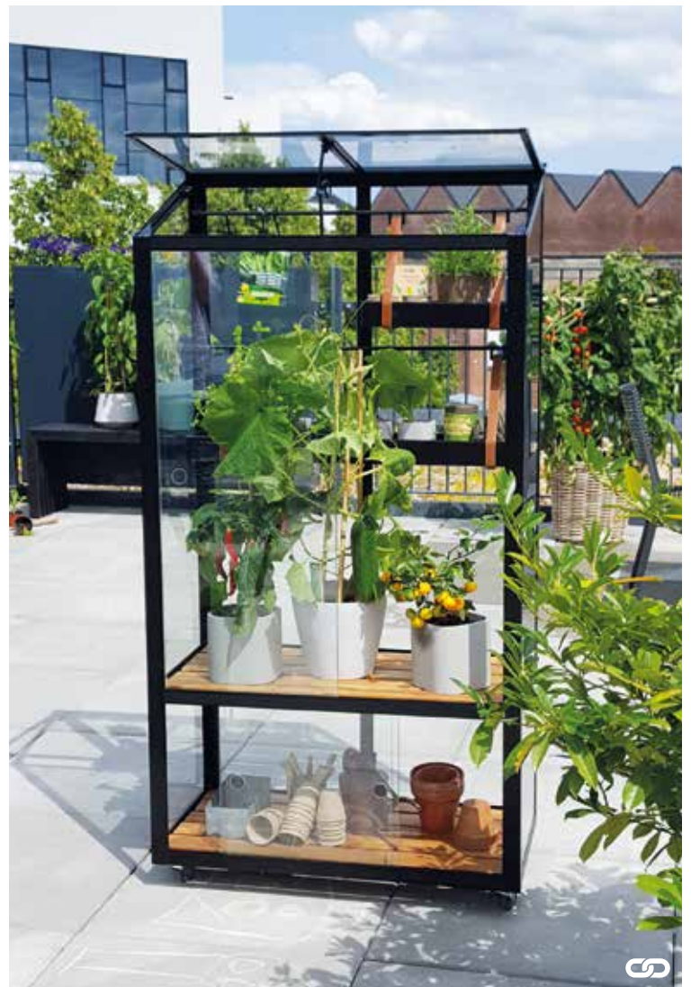
Juliana City Greenhouse können Sie je nachdem wo und wie es verwendet werden soll aufstellen.

Beim Juliana Vertical gibt es Platz für Pflanzen sowohl innen als auch außen, es gibt eine kleine Arbeitsfläche, und das Spalier kann für Pflanzen oder Werkzeuge verwendet werden.