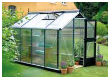
Gewächshaus mit Stegdoppelplatten.