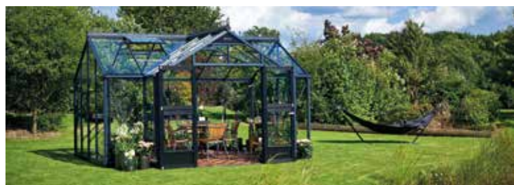
Juliana Orangeri ist ein schönes Gewächshaus mit Erker. Siehe Seite 6.