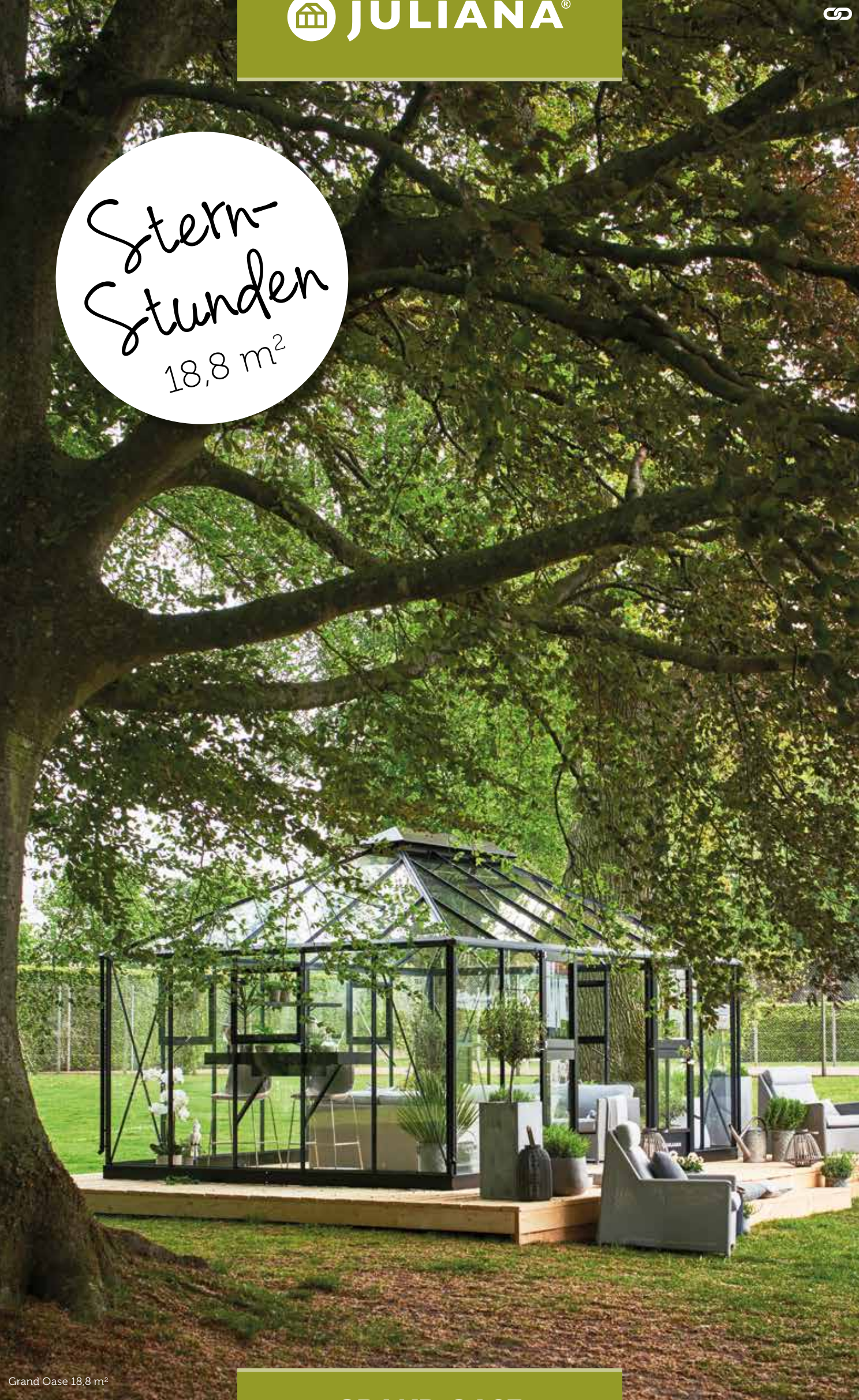
Grand Oase 18,8 m 2