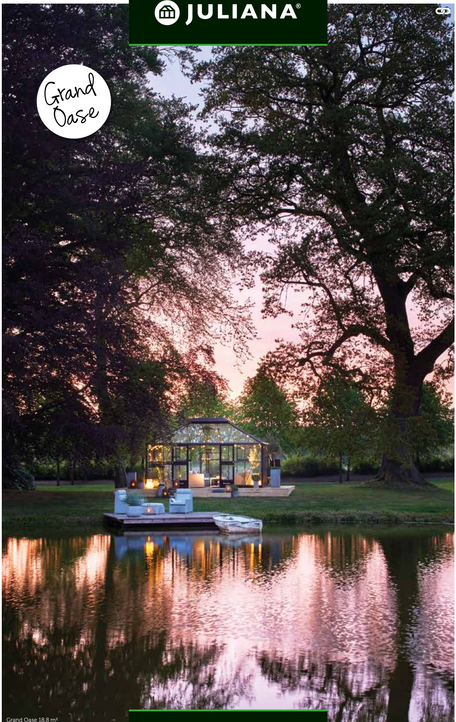
Grand Oase 18,8 m 2