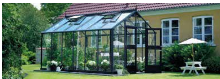
Das klassische rechteckige Modell. Hier Juliana Premium. Siehe Seite 10.