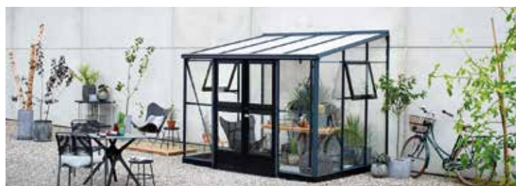
Juliana Veranda ist die perfekte Lösung, wenn man eine Wand hat. Siehe Seite 14.

Gewächshäuser gibt es in vielen Formen. Die klassische Form ist das rechteckige Gewächshaus, aber es gibt sie auch als Wandmodell, im Pavillonstil oder mit einem Erker. Eine Tomate gedeiht jedoch ebenso gut in einem runden wie in einem quadratischen Gewächshaus. So ist es eine individuelle Einschätzung und hängt vom persönlichen Geschmack und Stil ab.