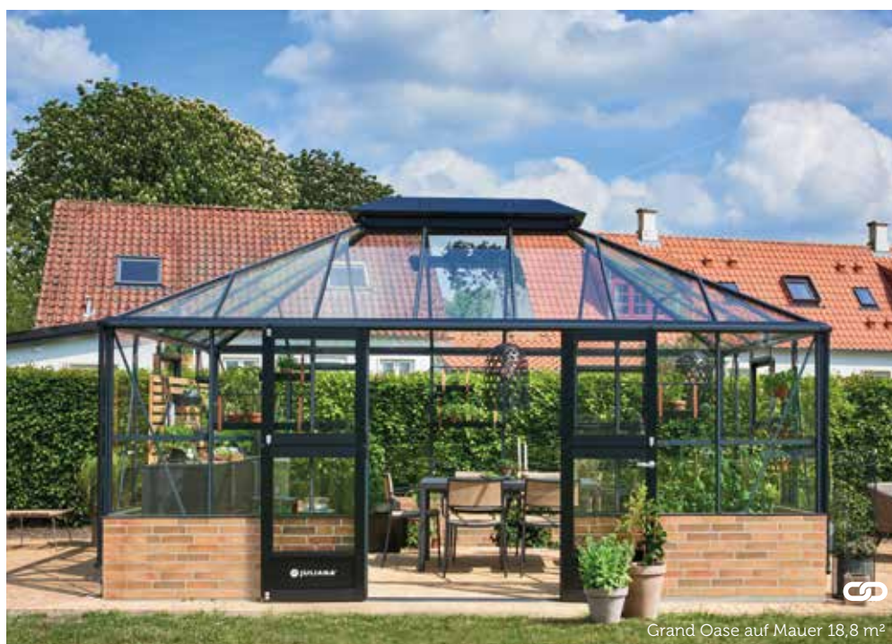
Grand Oase auf Mauer 18,8 m 2