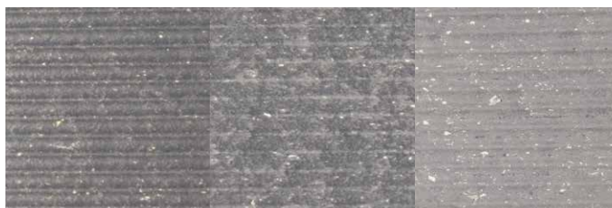
Neu 3 Jahre 6 Jahre

Typische Alterung einer Diele in der Farbe Steingrau unter mitteleuropäischen Klimabedingungen.