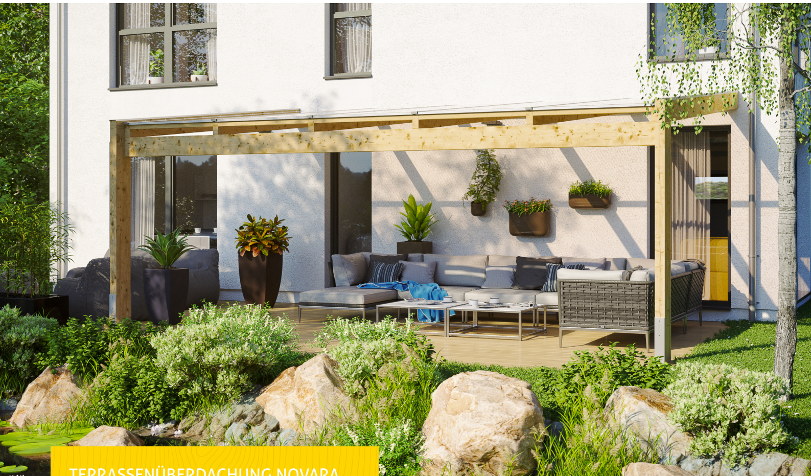
TERRASSENÜBERDACHUNG NOVARA 557 x 259 cm

Massive Konstruktion aus hochwertigem Leimholz (BSH-Fichte)