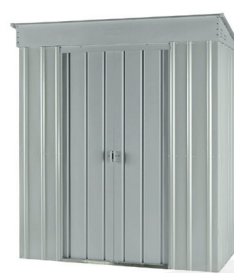
SKILLION S64 SKILLION S86