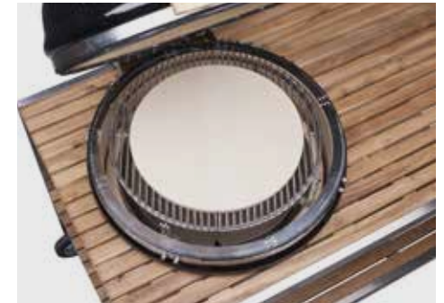
Aufbau für Pizza (optionales Zubehör)