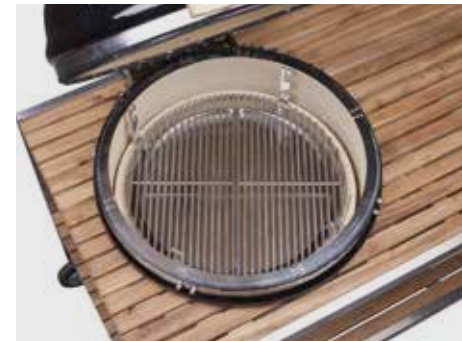
Deflektorstein geteilt, Tropfschale geteilt, zwei halbe Edelstahlroste, Ring zur Höhenverstellung