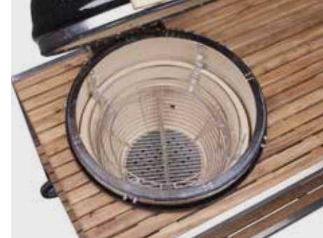
Kohlekorb mit Trenner