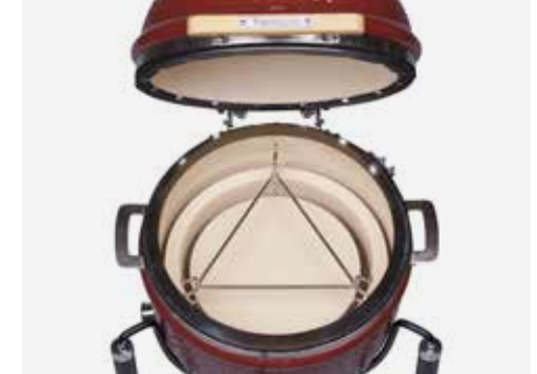
Deflektorstein mit Distanzstück zum indirekten Garen