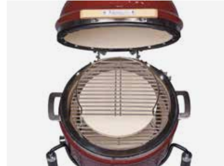
Komplettaufbau mit Edelstahlgrillrost und Zusatz-Grillrost