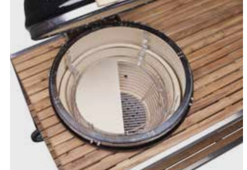
Deflektorstein (geteilt) mit Distanzstück zum indirekten Garen