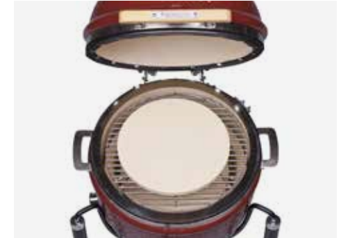
Aufbau für Pizza (optionales Zubehör)