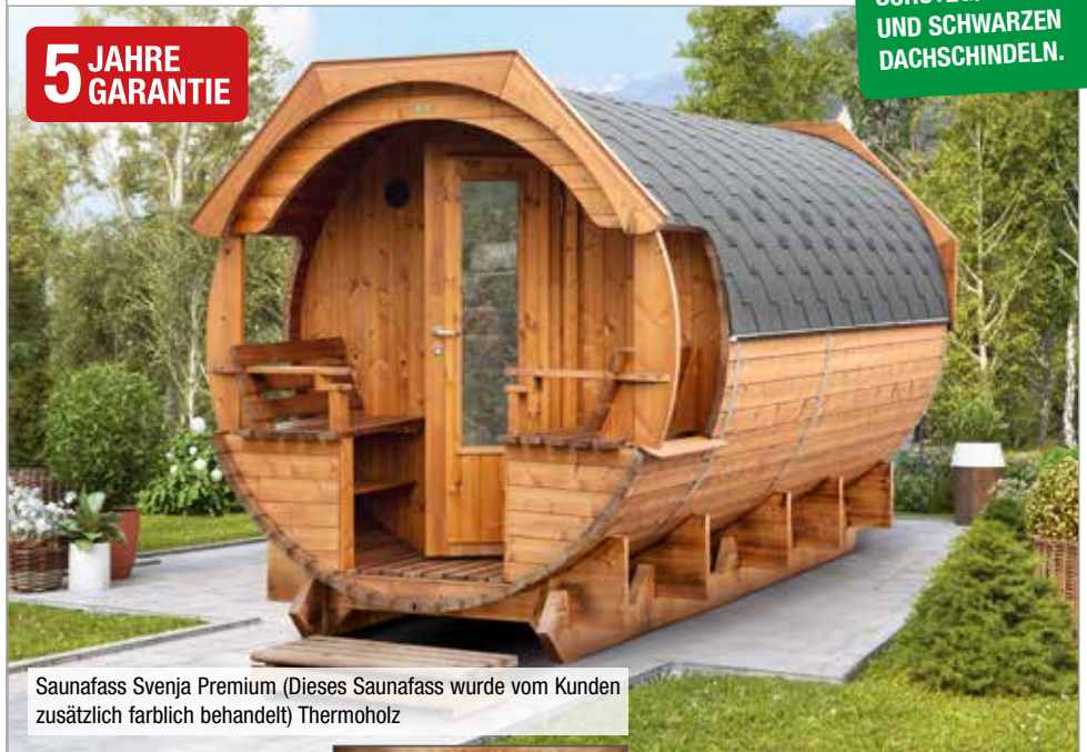
Saunafass Svenja Premium (Dieses Saunafass wurde vom Kunden zusätzlich farblich behandelt) Thermoholz