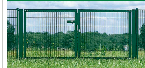
LEGI-Tor VARIO-S 2-flügelig