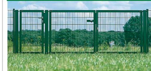
LEGI-Tor VARIO-S 3-flügelig