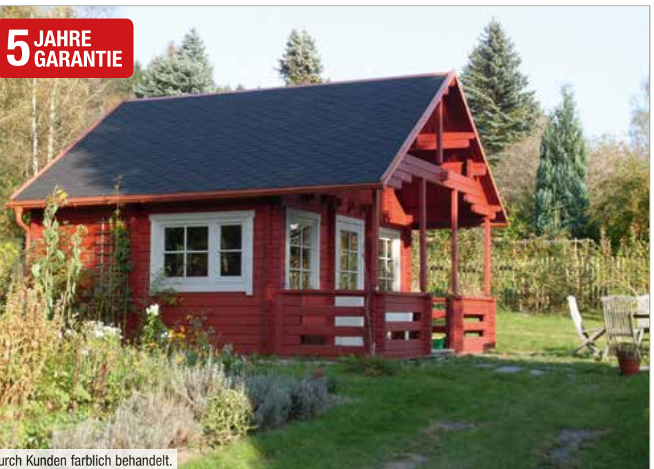
Durch Kunden farblich behandelt.

70 mm / 517x397 cm / Wohnfläche 20,5 m 2