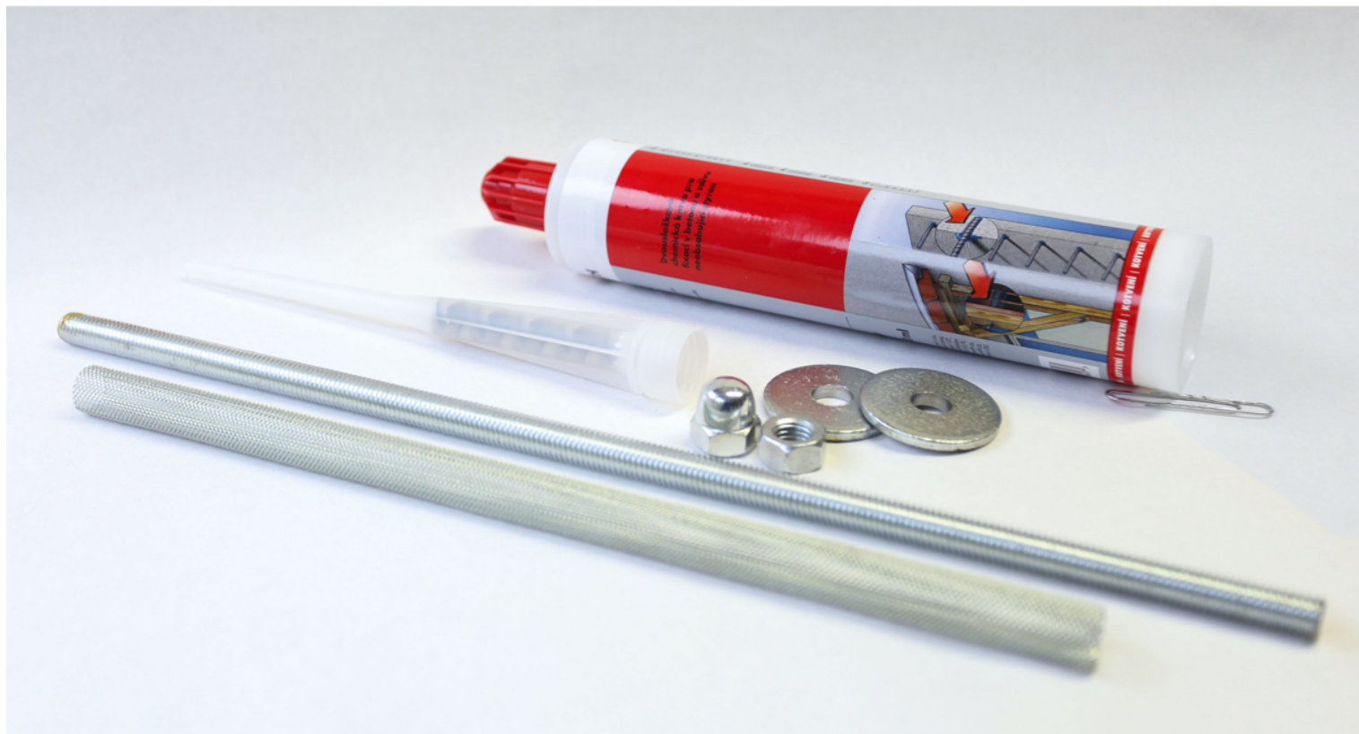
Materialien vom Wandbefestigungsset